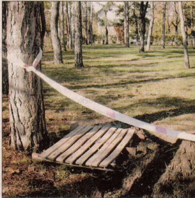
A méteresnél is mélyebb gödör komoly veszélyforrást jelent